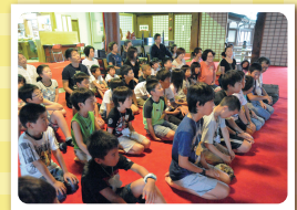
【神妙に朝のお勤め】

四国霊場第七十五番札所 場所：総本山善通寺内(宿坊・遍照閣) (香川県善通寺市善通寺町3-3-1) 対象：未就学児(4歳～6歳)・小学生・中学生 定員：80名(定員になり次第締め切ります) 費用：子ども一人 10,000円 (2泊3日の宿泊費・食費・保険代含む、大阪からのバス代は別途3,000円)