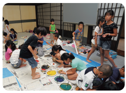
【道具隊～小道具制作中】

四国霊場第七十五番札所 場所：総本山善通寺内(宿坊・遍照閣) (香川県善通寺市善通寺町3-3-1) 対象：未就学児(4歳～6歳)・小学生・中学生 定員：80名(定員になり次第締め切ります) 費用：子ども一人 10,000円 (2泊3日の宿泊費・食費・保険代含む、大阪からのバス代は別途3,000円)