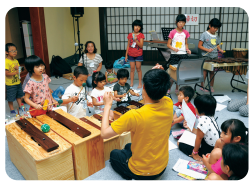
【音楽隊～合奏の練習】