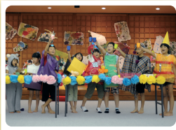
【役者隊～パーティしよう！】