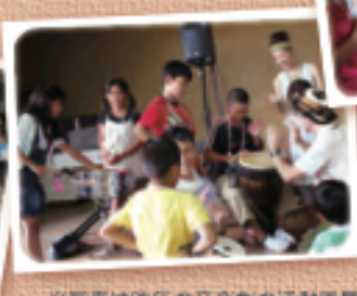
※写真は昨年(2013年)の音楽劇の活動風景です。